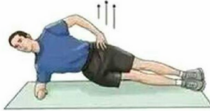
Yan Bel Güçlendirme