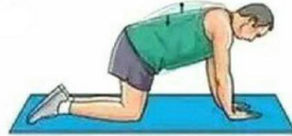
Kedi - Deve Hareketi