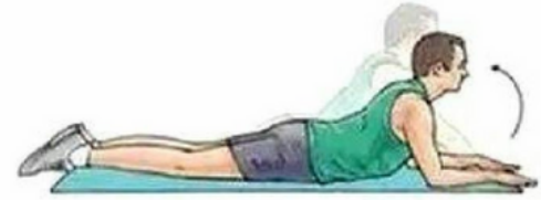
Bel- Sırt Güçlendirme