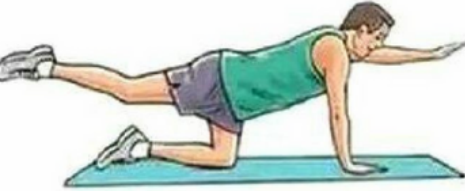
Çapraz Kol Bacak Hareketi